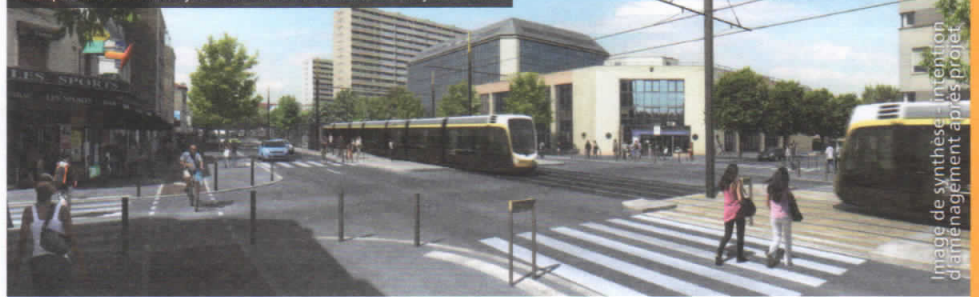
Perspective du tramway devant le marché Barbusse à Ivry-sur-Seine.

Image de synthèse : intention d'aménagement après projet.