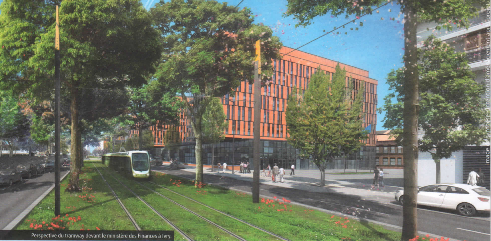
Perspective du tramway devant le ministère des Finances à Ivry.

Image de synthèse - Intention d'aménagement après projet