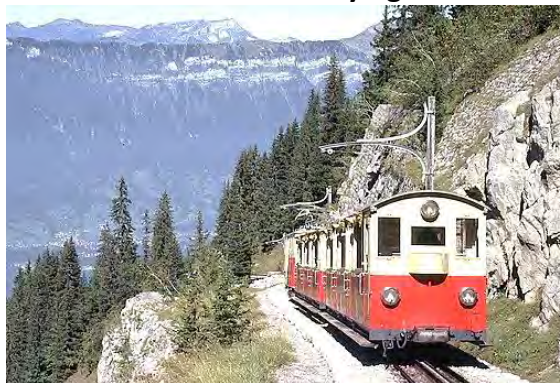
Train du Schynige Platte