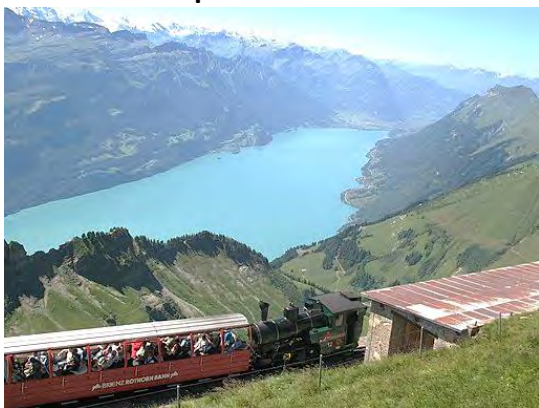
Panorama depuis le Brienzner Rothorn