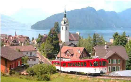
Train VRB au départ de Vitznau