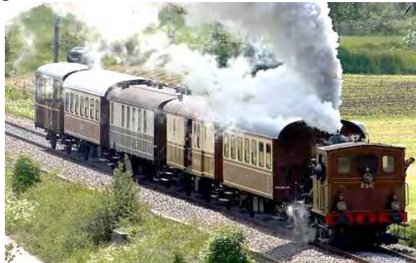
Train vapeur du VVT