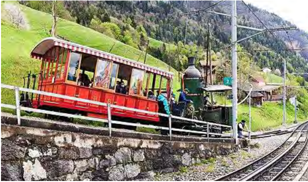
Loco à vapeur n°7 du chemin de fer Vitznau Rigi