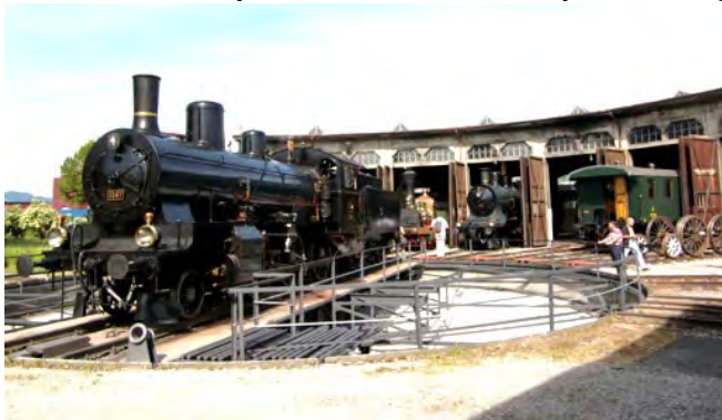
Locomotive à vapeur du type B 3/4 des CFF au Parc ferroviaire de Brugg