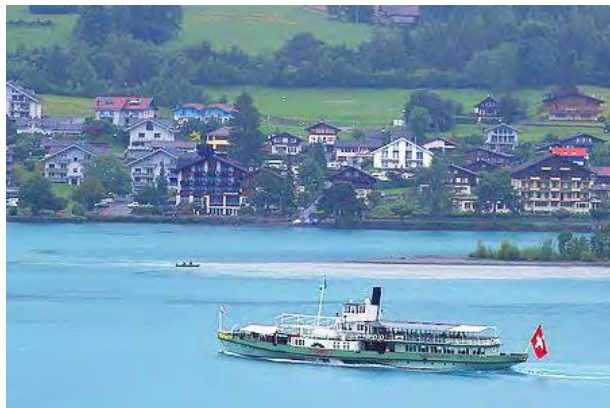
Bateau à vapeur Lötschberg