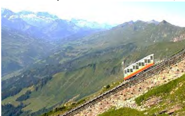
Funiculaire de Niesen