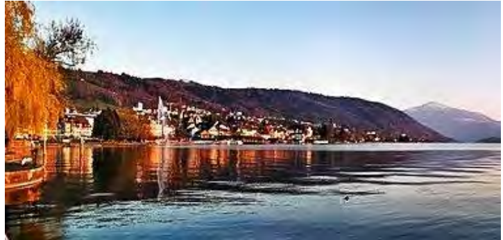
Vue sur la ville de Zoug et sur le Rigi depuis le bord du lac