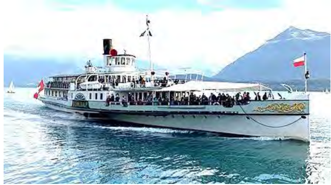
Bateau à vapeur Blüemlisalp sur le lac de Thoue